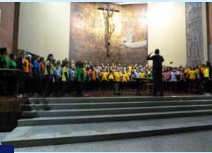
CORAL DE L'ESCOLA DE MÚSICA DE MANLLEU ETA ORERETA TXIKI, ORERETA ETA OINARRI ABESBATZAK 2012/04/30